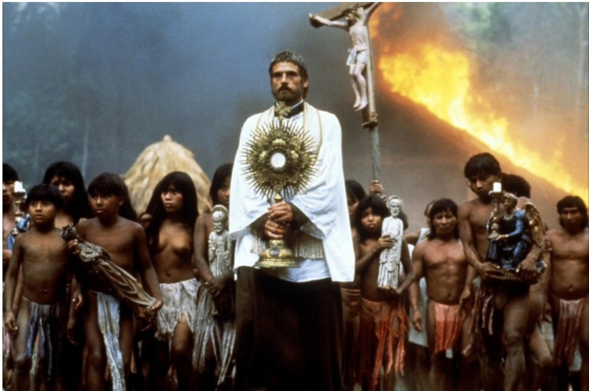
Image tirée du film Mission de Roland Joffré