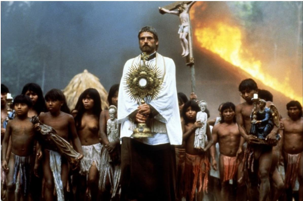
Image tirée du film Mission de Roland Joffré