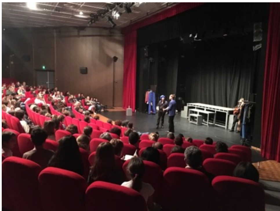
Un décor minimaliste, un texte riche et fort pour « Candide ».